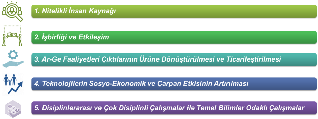
Şekil 4. Ülkemizde BTY Ekosistemini Etkinleştirecek Yatay Alanlar

Kurultay kapsamında nitelikli insan kaynağı; işbirliği ve etkileşim; Ar-Ge faaliyetleri çıktılarının ürüne dönüştürülmesi ve ticarileştirilmesi; teknolojilerin sosyo-ekonomik ve çarpan etkisinin artırılması ve disiplinlerarası/çok disiplinli çalışmalar ile temel bilimler odaklı çalışmalar olmak üzere ülkemizde BTY ekosistemini etkinleştirecek beş yatay alanda (Bkz. Şekil 3), her bir alanda iki grup olmak üzere toplam on eşzamanlı odak grup çalışması gerçekleştirilmiştir.