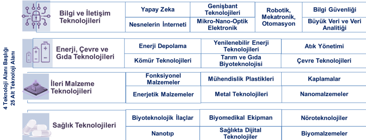
Şekil 3. Çalışmada Kapsanan Teknolojiler

“Küresel Eğilimlere Göre Yükselen Teknolojiler” başlığı altında düzenlenen eş zamanlı odak grup çalışmaları tematik odaklı gerçekleştirilmiş olup; söz konusu temalar Eylül 2019’da Cumhurbaşkanlığı Bilim, Teknoloji ve Yenilik Politikaları Kurulu tarafından kamuoyu ile paylaşılan “Teknoloji Alanı Önceliklendirme Çalışması”nın sonuçları doğrultusunda belirlenmiştir. Belirlenen temalar bilgi ve iletişim teknolojileri; enerji, çevre ve gıda teknolojileri; ileri malzeme teknolojileri ve sağlık teknolojileri olmak üzere dört ana başlıkta toplanmıştır (Bkz. Şekil 3). Grup sayıları katılımcıların araştırma alanlarına göre şekillenmiştir. Bilgi ve iletişim teknolojilerinde üç grup; enerji, çevre ve gıda teknolojilerinde iki grup; ileri malzeme teknolojilerinde iki grup ve sağlık teknolojilerinde üç odak grup olmak üzere toplamda on eş zamanlı grup çalışması gerçekleştirilmiştir.